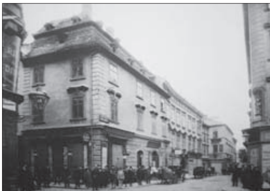
V roce 1905 měli na rohu obchod bratři Kleinovi.