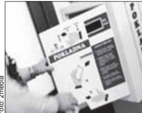
AUTOMAT na poplatky

Staré Brno - Policie dopadla zloděje, který půl roku vybíral automaty na poplatky v nemocnicích. Vykradl také kadeřnictví, hodinářství a další provozovny. Přišel si tak na pěkných 300 tisíc.