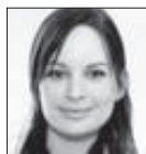
Jitka Čvančarová HEREČKA