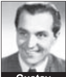
Gustav Nezval HEREC