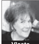
Vlasta Chramostová HEREČKA