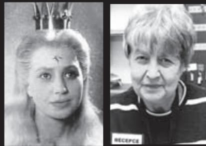
Princezna roku 1959 Receptní roku 2011

POŘADÍ: ●1. Rotor bar, Dvořákova 12. ●2. Kavárna a pekařství Zaslávka, Tábořská 232. ●3. Caffé Encounter, Kounicova 35. ●4. Caffé bar España, Joštova 4. ●5. Caffé del Saggio, Helceletova 2. ●6. Parnas Caffé, Želný trh 20. ●7. Caffé Maia, Jaseňská 7. ●8. Park Lane Caffé, Lužánecká 4a. ●9. Kavárna Spolek, Orlí 22. ●10. Caffé Minor, Údolní 64.