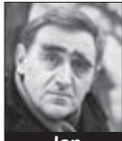
Jan Skácel BÁSNÍK