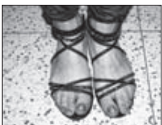
LUPIČ v civilu (vlevo). Jeho nehty v převleku (vpravo).