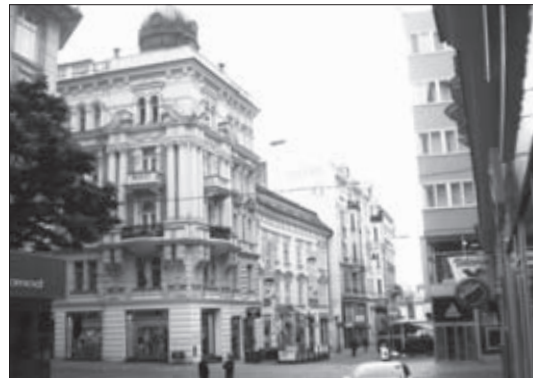
DNES je na rohu Masarykovy a Orlí obchod s oblečením

POSÍLEJTE své fotografie pořízené ze stejného místa na adresu: redakce@starobrnenskenoviny.eu