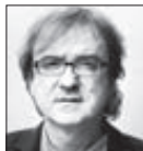
Miro Žbirka MUZIKANT