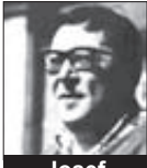
Josef Kainar BÁSNÍK

Jan Skácel: † 7. 11. 1989. Brněnský básník, šéfredaktor kulturní revue Host do domu. (* 7. 2. 1922)