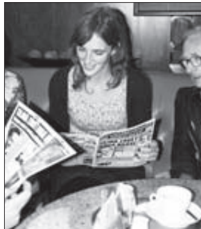
Typická čtenářka SBN.